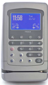
Terminale Trax per la lettura degli ordini