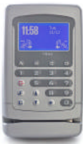
Terminale Trax per la lettura del badge